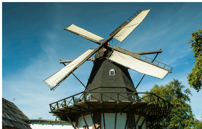
Skenkelsø Mølle, som i dag forsat er i drift om mølle og derudover huser både et kulturhistorisk museum og lokalarkiv for Egedal Kommune.

Den hollandske vindmølle fra 1891 fungerer stadig og mæler mel, som en af meget få møller i Nordsjælland. Møllen er monteret med svanskrøjer og kludesejl, hvor man fra møllens omgang kan indstille sejlene på møllen efter hvor kraftigt det blæser. Indtil omkring 1900 var møller et udbredt syn i landskabet, da man var afhængig af at få malet sit mel, men konkurrencen fra de større industrimøller betød at hovedparten af de gamle vindmøller forsvandt.