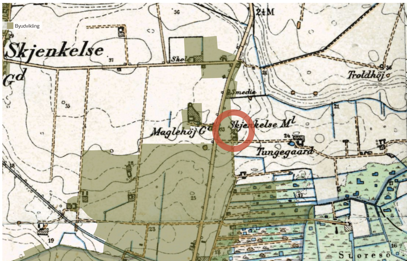
Historisk kort (1842-1899) med udpegnig af Skenkelsø Mølle og byudviklingen og Ølstykke Stationsby.

Der afholdes mølledage for publikum, 1. lørdag i måneden fra april til oktober, hvor der sættes fokus på kulturhistorien gennem aktiviteter målrettet børnefamilier. Åbningstider udover dette er tirsdag og torsdag formiddag. Museets samlinger er koncentreret omkring mølledrift, landbrug, håndværk, dragter og forstadshistorie.